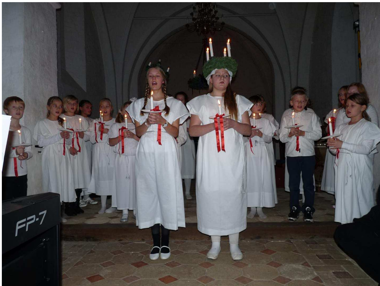
Lucia i Fodby Kirke