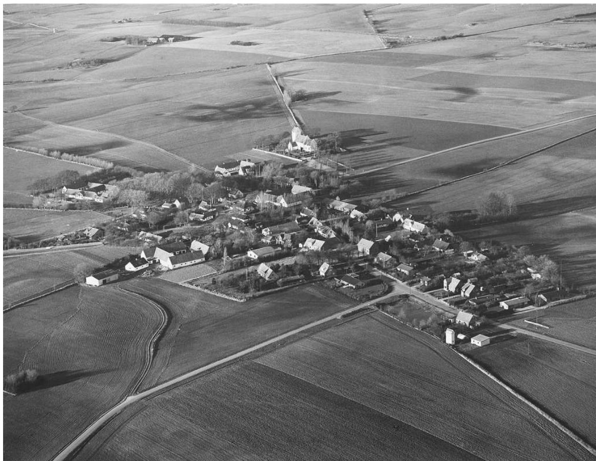
Luftfoto over Fodby fra ca. 1980

Næste møde er den 2. februar kl. 19.00 i Sognegården