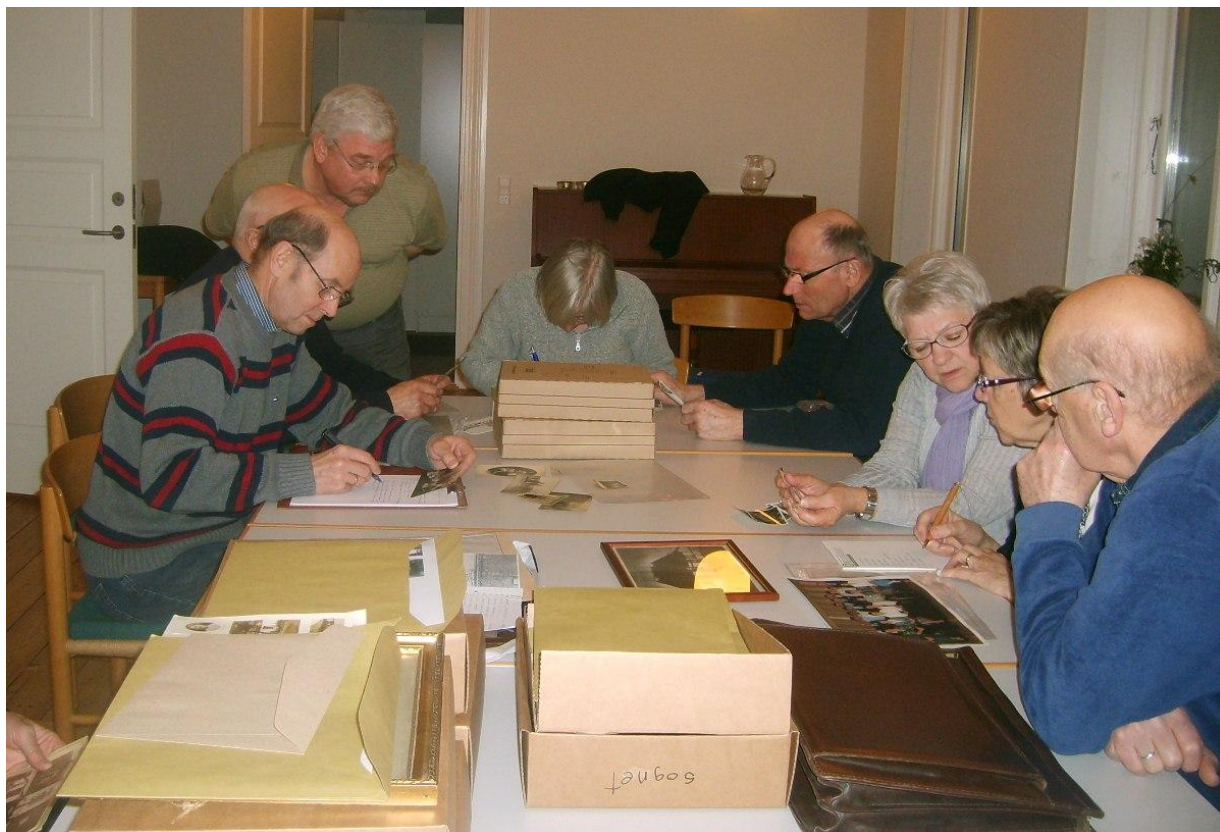
Den lokalhistoriske arkivgruppe