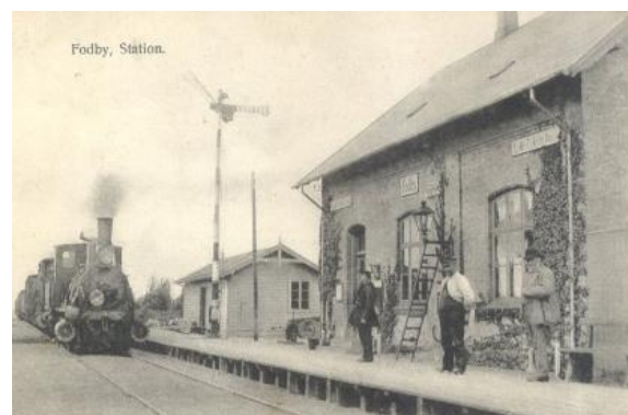
Fodby Station i 1910