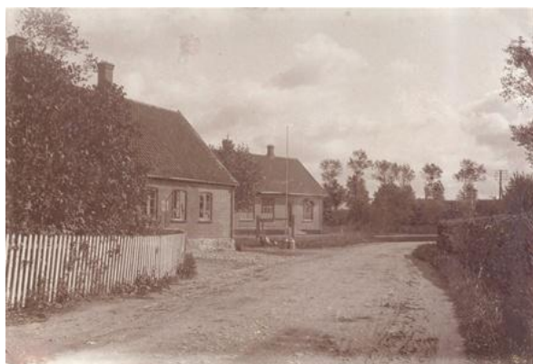
Fodby forskole i Fodbygade