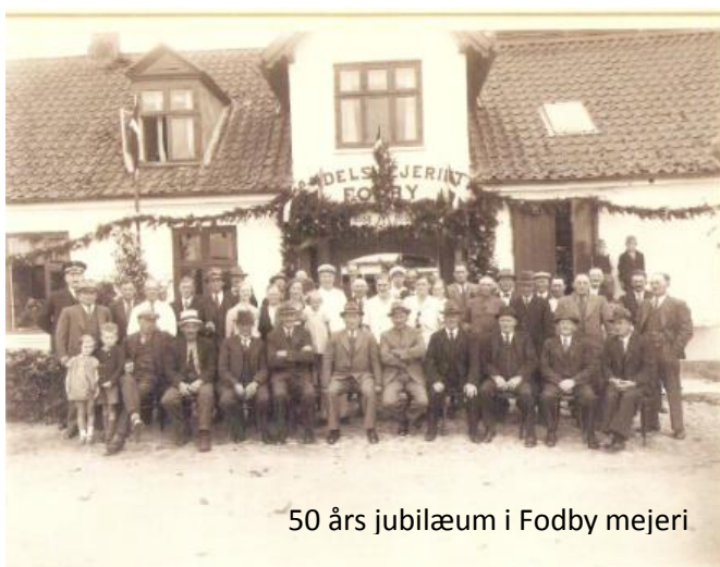
50 års jubilæum i Fodby mejeri