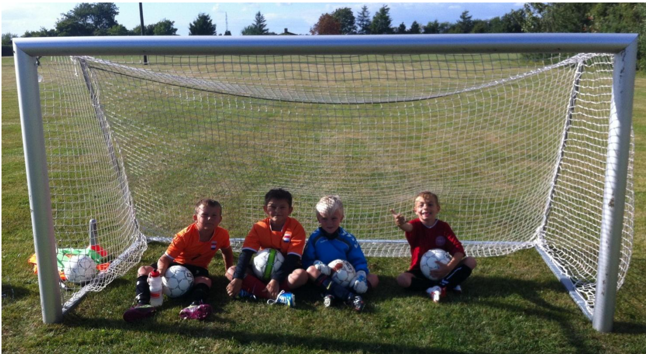
En del af miniholdet i Fodby GF