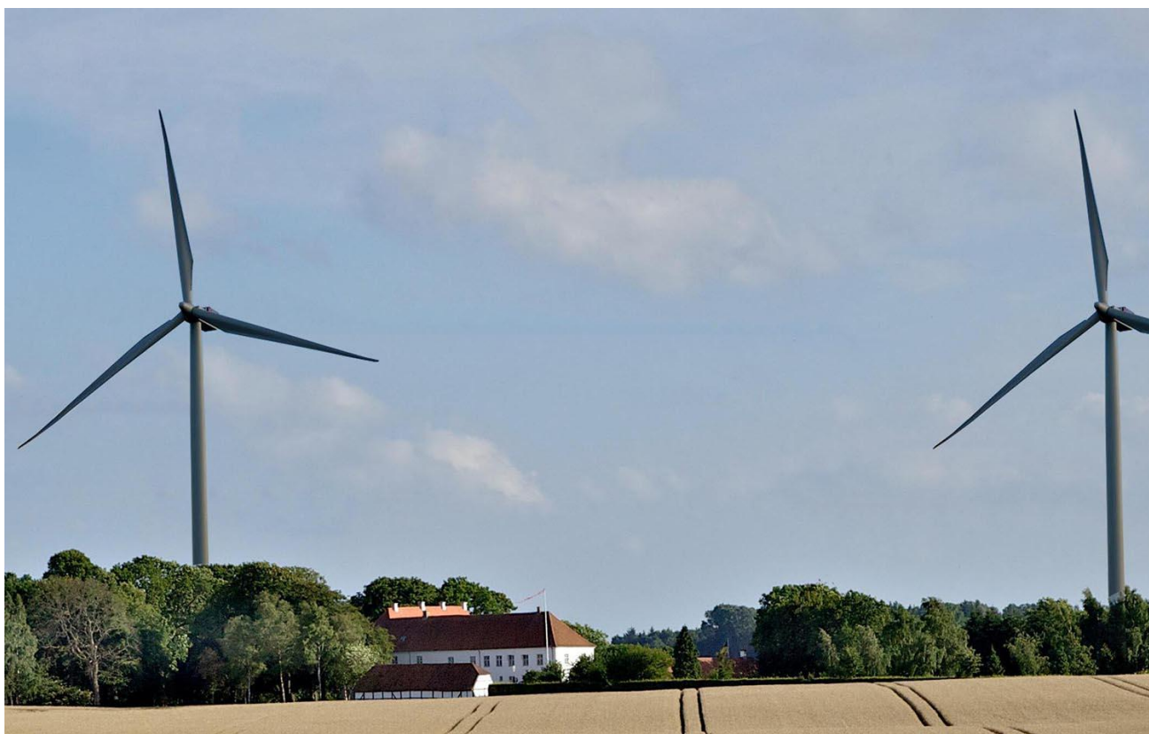
Saltø gods med 155m høje vindmøller (Visualisering)

Borgerne i området har af flere omgange, både som grupper og enkelt personer kommet med indsigelser imod de store møller.